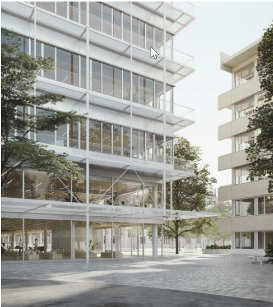
Visualisierung (Blick von Maulbeerstrasse), © Karamuk Kuo Architekten